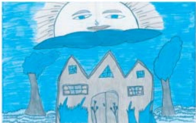
上：母には家を持つ夢があります。この絵の家は私が大きくなったら両親に買ってあげたい家です。ブラジル / シネジオ・ホッサ小 5年生

2005年度は県内6校（朝日小学校、加納岩小学校、上野小学校、甲府北中学校、竜王小学校、山梨南中学校）の皆さんと、アメリカ1校、ブラジル4校、中国2校1団体の皆さんがこのプログラムに参加し、371点の絵が交換されました。みなさんの絵をホームページでご紹介していますので、山梨の子どもたち、そして海外の子どもたちの絵もぜひご覧ください。