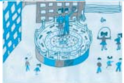
右：私たちの学校。中国 / 彭州市実験小学校 4年生