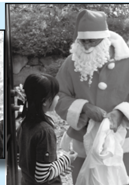
Cenas do Natal Solidário de 2008.