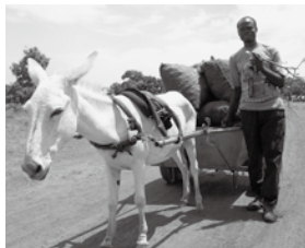
かわいいロバの馬車