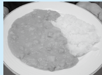
LOCRO DE ZAPALLO