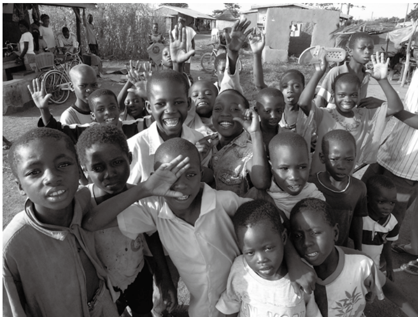
元気なガーナの子どもたち