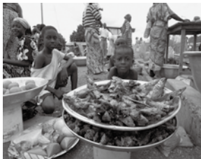
路上マーケットにて