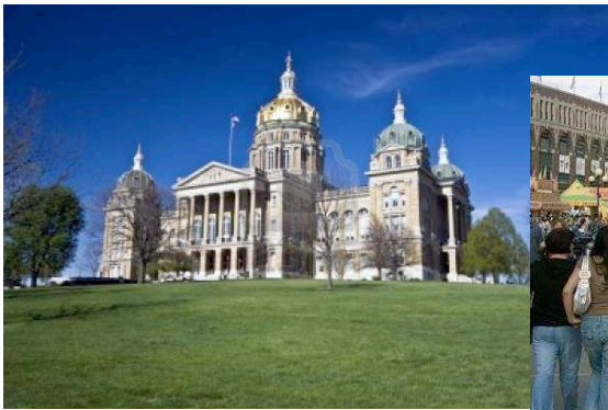
アイオワ州議会議事堂