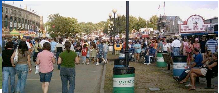
アイオワ・ステート・フェア