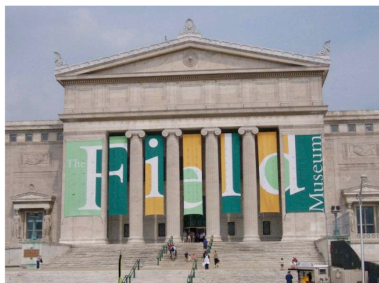
フィールド自然史博物館